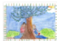
Le ragazze si addormentano