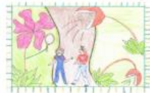
le piante urlanti

Ma non era l'unica lezione che dovevano imparare, infatti, poi il folletto le portò in giro per il regno, ad osservare tutte le piante magnifiche che si trovavano lì, c'erano piante di tutti i tipi: le piante strillanti, se anche per sbaglio le calpesti iniziano ad urlare in modo stridulo al punto che si sentivano fino dall'altra parte del regno; hanno anche conosciuto le piante vanitose che non ti fanno passare se prima non fai un complimento sincero.