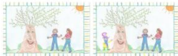
vecchio albero magico

“Vi siete divertite oggi? E' stata una giornata lunga vero? Scommetto però che avete imparato tante cose importanti e che vi serviranno nella vita reale” disse l'albero. Le ragazze quindi risposero con voce incerta:” Si abbiamo visto tante cose ed incontrato persone speciali tra cui anche il nostro nuovo amico folletto.