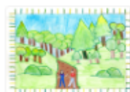
Il bosco e il sentiero

Stanche ed infastidite, decisero di riposarsi sotto un albero, sperando che i loro genitori le venissero a prendere. Le ore passavano e le ragazze si addormentarono spalla a spalla.